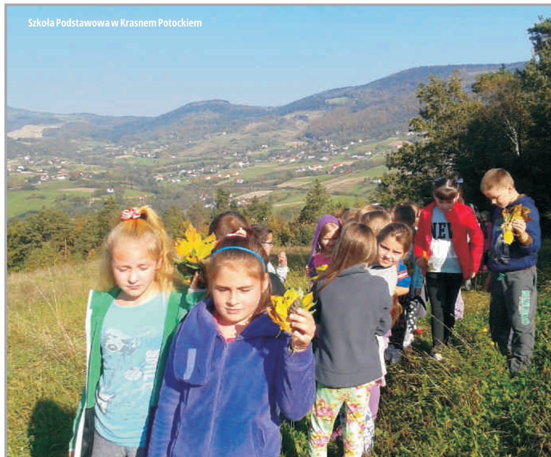
Szkoła Podstawowa w Krasnem Potockiem