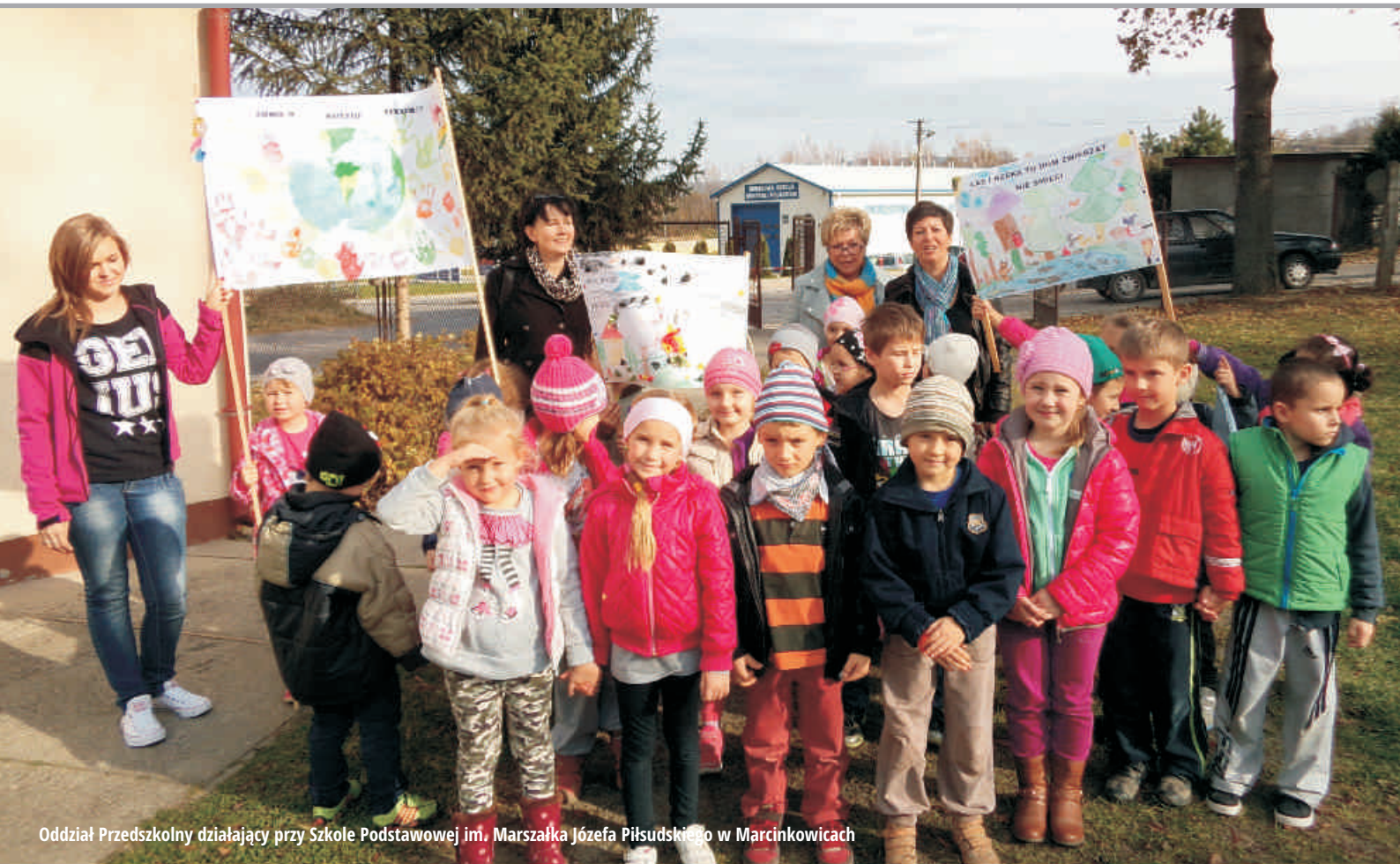
Oddział Przedszkolny działający przy Szkole Podstawowej im. Marszałka Józefa Piłsudskiego w Marcinkowicach