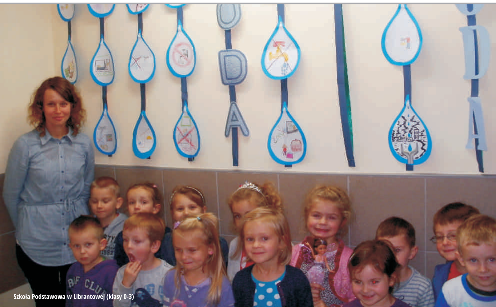
Szkoła Podstawowa w Librantowej (klasy 0-3)