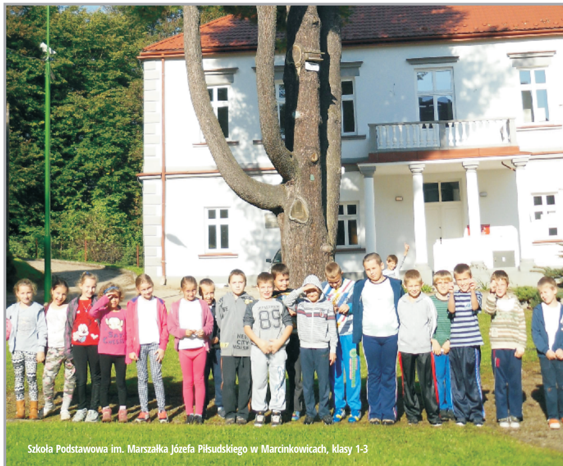
Szkoła Podstawowa im. Marszałka Józefa Piłsudskiego w Marcinkowicach, klasy 1-3